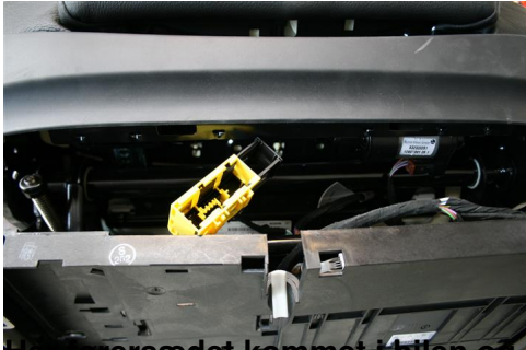
Her førersædet kommet i bilen og er nu klar til at blive monteret..