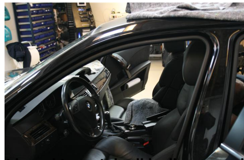
Slæder bilen kødet og og tjekket for at alt er monteret korrekt og at der ikke ligger nogle fejl nogle