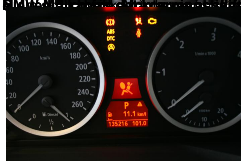
Beholdt alle de gamle og nye dele og sæt dem på det nye BMW M5 køretøj som er en af de bedste biler i verden