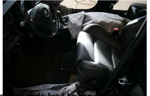
Alle informationer til den nye sæde er blevet lavet rigtigt når man ser det røde lys i knappen for så