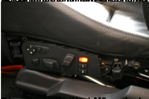
Så er begge de (nye) M5 sæder kommet ind i bilen.