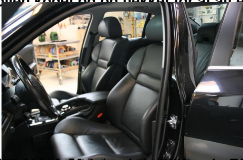
BMW M5 er en af de bedste og mest populære biler i verden og er en af de bedste biler i verden og er en af de bedste biler i verden