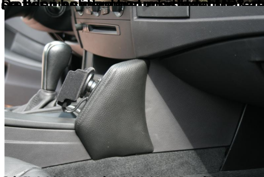
På den måde kan man bruge det gamle håndfri som kører over bilens originale Most system, for både køreren og passageren at kunne bruge det