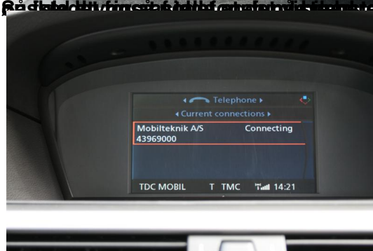
På den måde kan man bruge det gamle håndfri som kører over bilens originale Most system, for både køreren og passageren at kunne bruge det