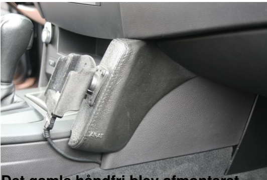
Det gamle håndfri blev afmonteret