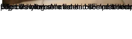
Vognbane lys set tæt på