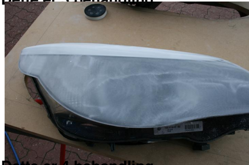
Dette er 4 behandling.