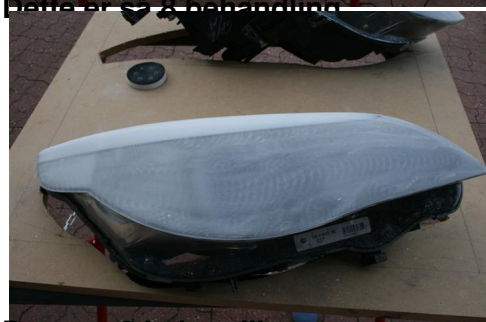
Dette er 8 behandling.