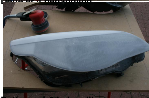
Dette er 5 behandling.