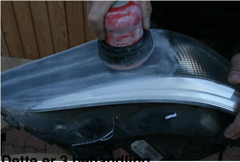
Dette er 3 behandling.